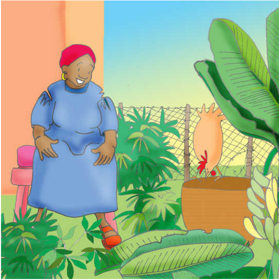
Fig grann mwen