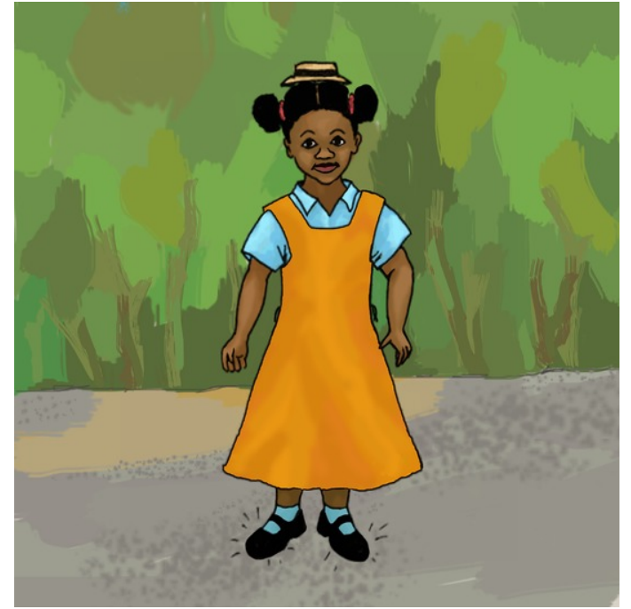
သူ့ရိုက် ကွက်တိယာ။