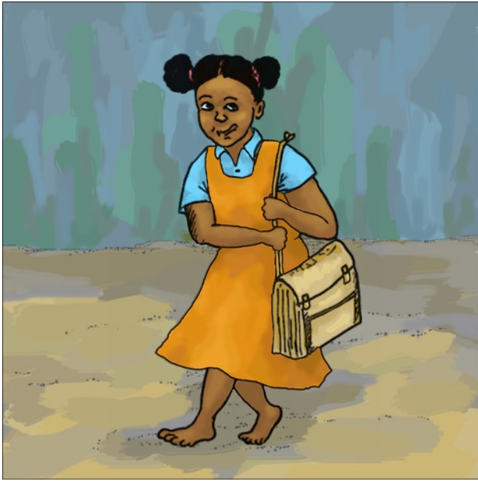
ဒေလွယ်အိပ် ကြီးရေ။