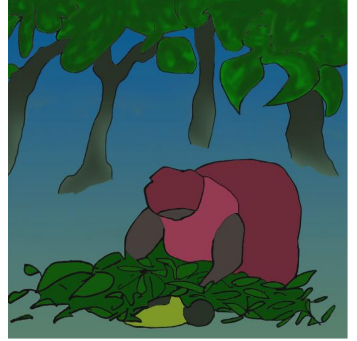
انا جانب تینگې د پانو لاندې پت کړ.