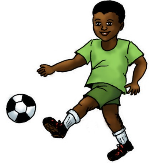
زه درسه شوت وهلای شم.