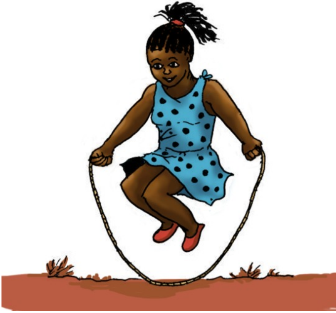
زه درسه پورته توپ وهلای شم.