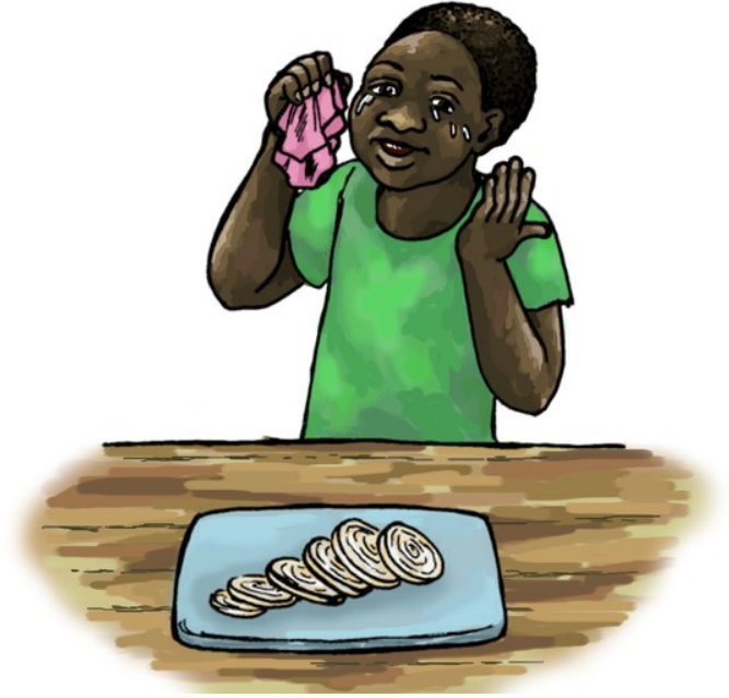
کله چپ پياز ميده شي، زما له سترگواوښکې بهېږي.