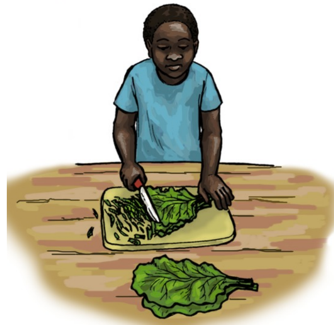
زه پالك ميده كوم.