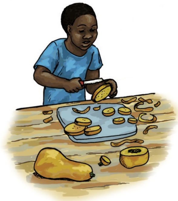
زه بٲرنٲ (د ميوې نوم) ميده كوم.