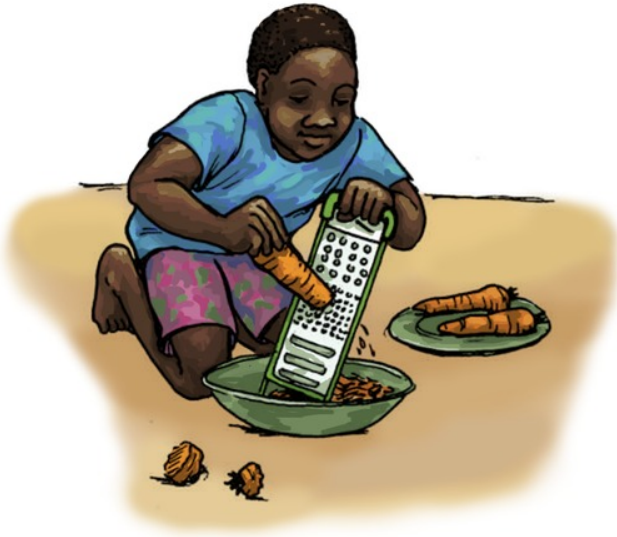
زه گازري ميده كوم.