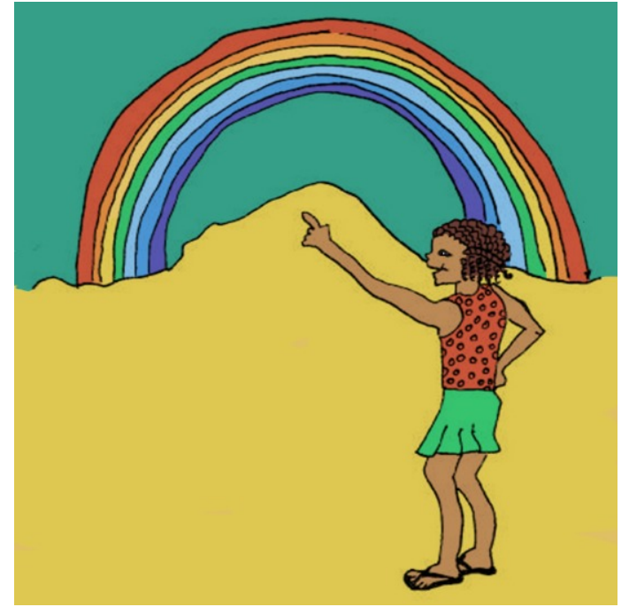
من یک رَنگین گَمان می بینم.