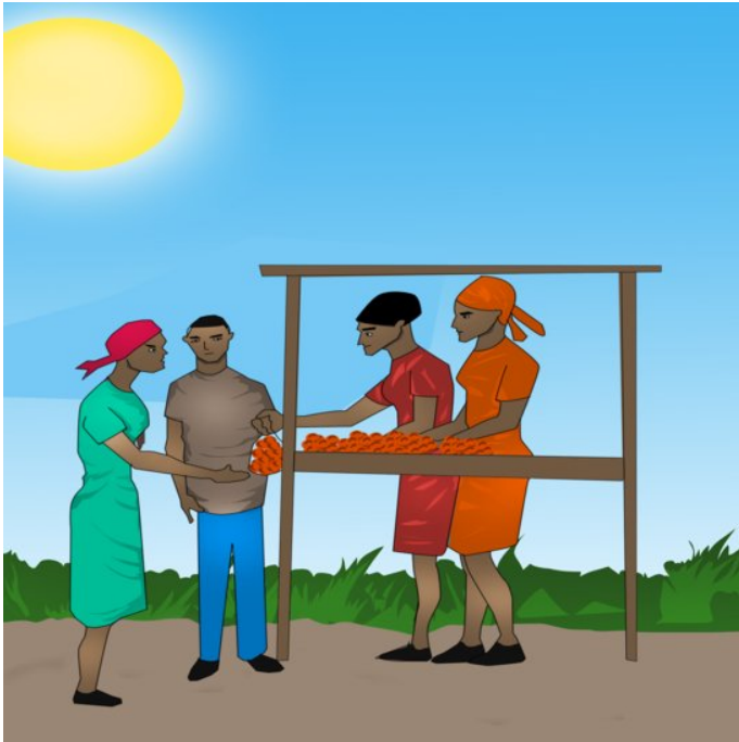
Folk på marknaden kjøper frukt.