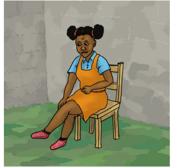
Sokkane er korte.