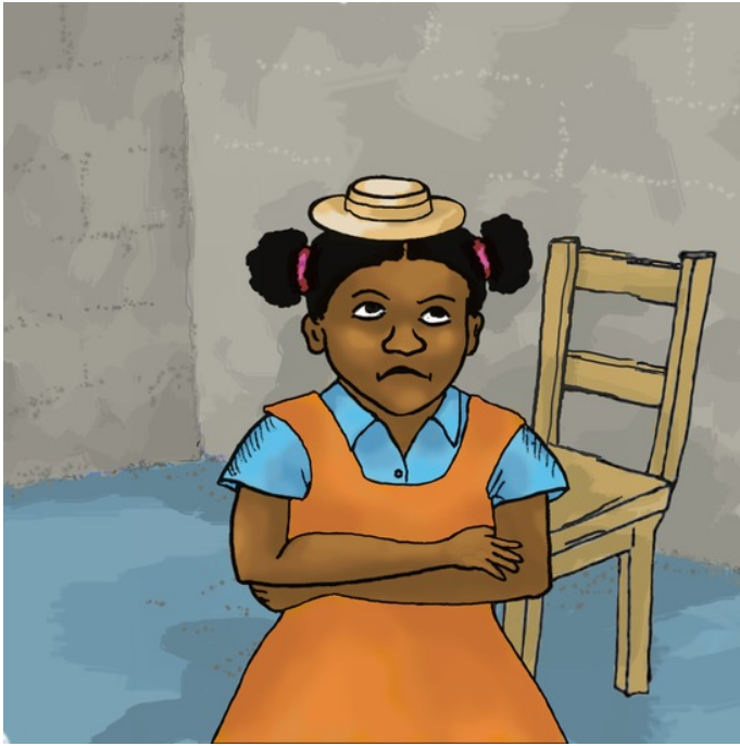
Denne hatten er liten.