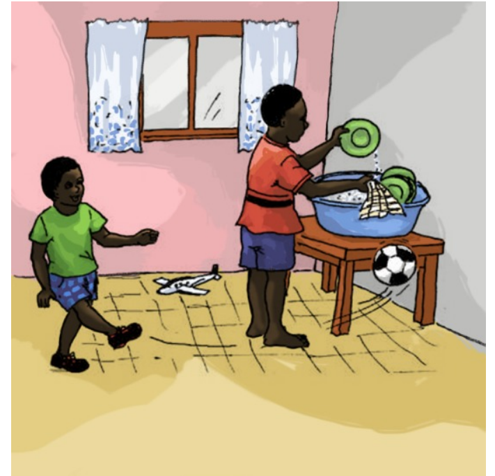
Ik doe de afwas.