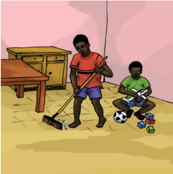
Ik veeg de vloer.