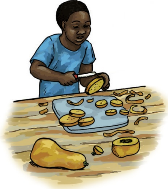
હું બટરનટ ને કાપું.