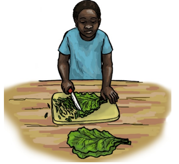
હું પાલક કાપું.