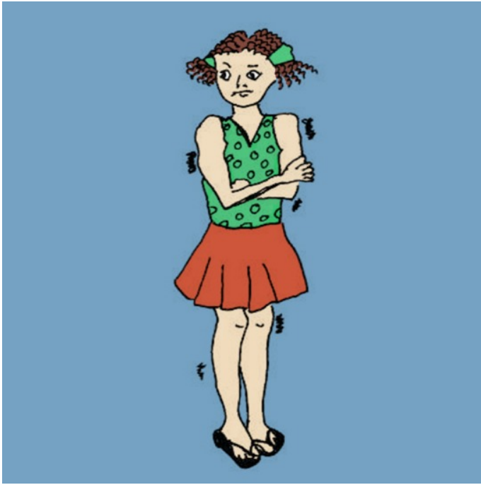
هَوا سَرَد اَسْت.