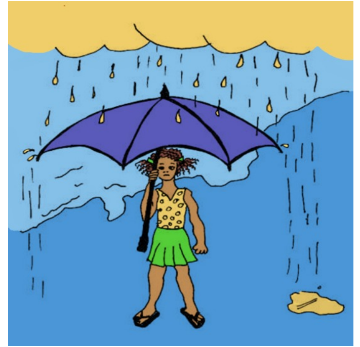
بَاران مِی بَارَد.