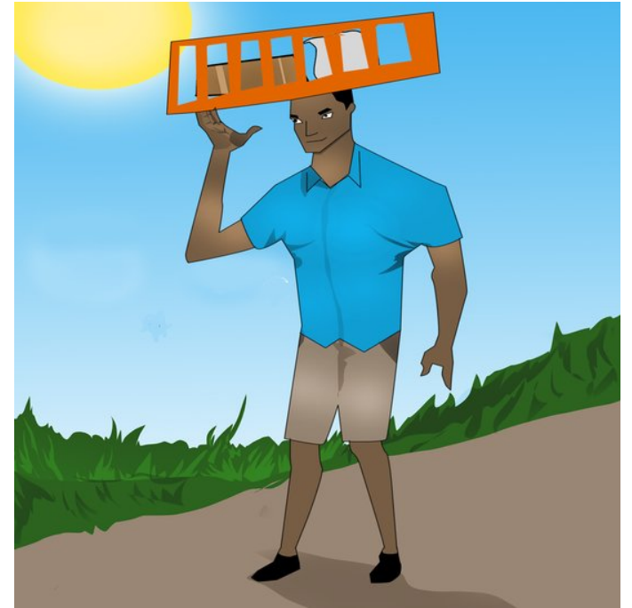
Tom metas la pleton sur sia kapon kaj iras hejmen.