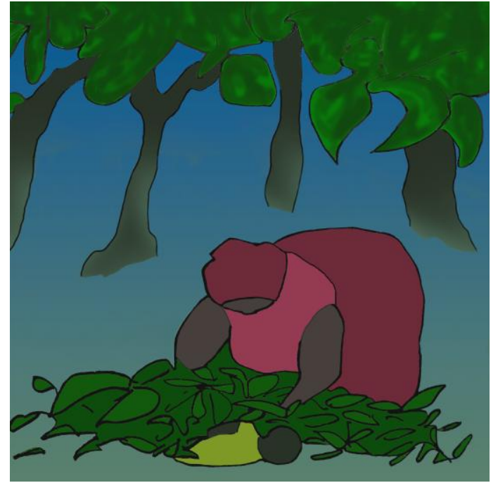
Avino kaŝis Tingi sub la folioj.