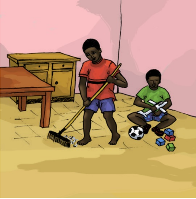
من عه رزه كه گه سكه ده دههه.